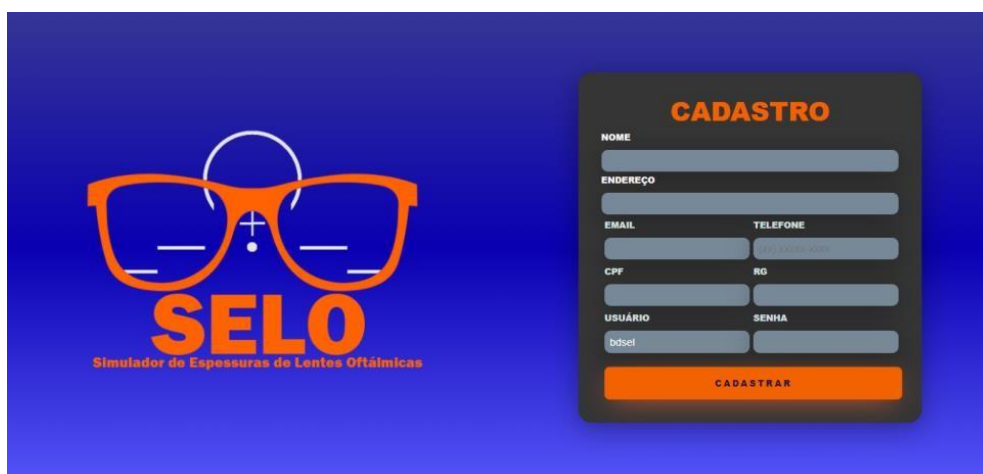
Figura 2 – Tela de Cadastro

Caso o usuário clique em “Comece agora”, se não estiver cadastrado, ele será redirecionado à tela de cadastro, mostrada na Figura 2: