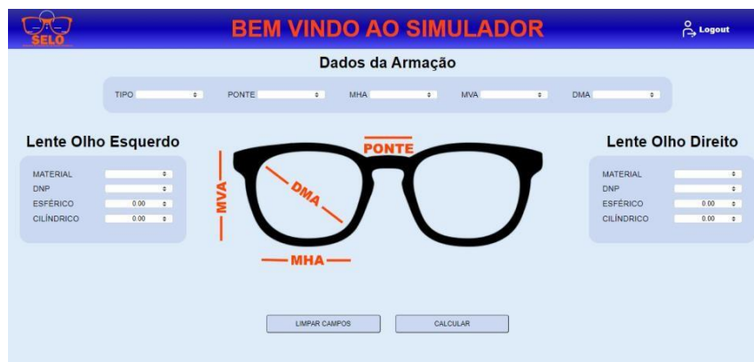
Figura 4 – Tela do Simulador

Depois de fazer o Login, o usuário será redirecionado à tela do Simulador, onde ele poderá realizar os cálculos das lentes oftálmicas, também há um botão escrito “Calcular” que, quando clicado, vai reunir todas as informações contidas nos campos do formulário e irá realizar o devido cálculo da lente especificada, como podemos ver na Figura 4: