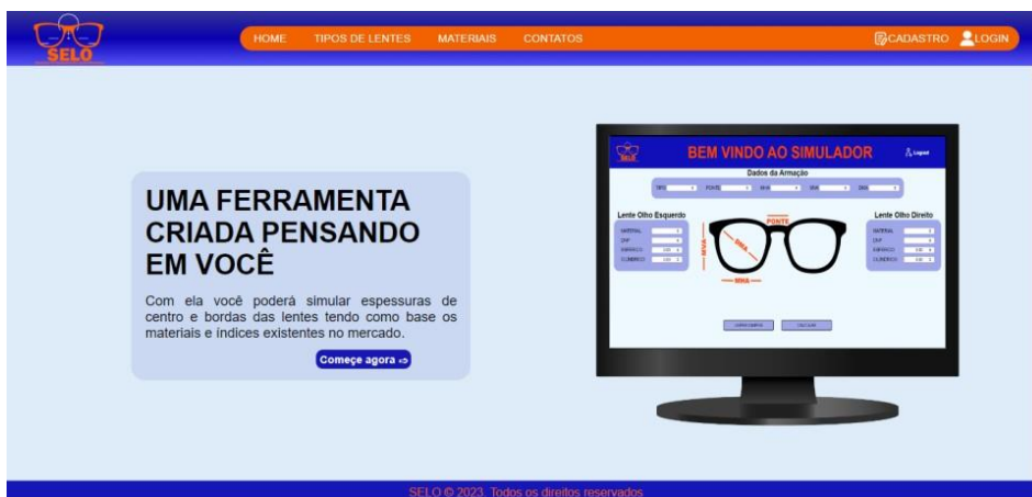
Figura 1 – Tela Inicial