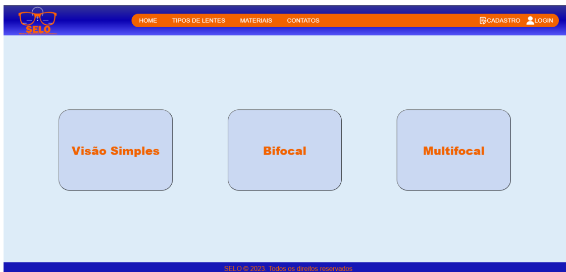
Figura 5 – Tela dos Tipos de Lentes