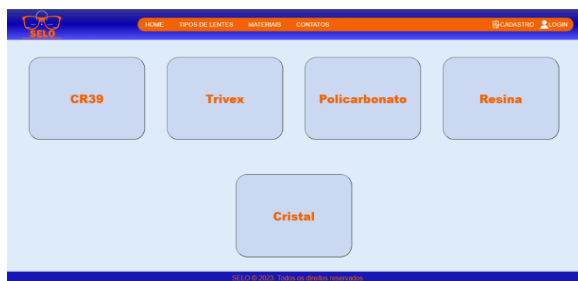
Figura 7 – Tela Dos Materiais