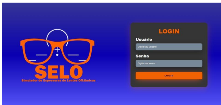
Figura 3 – Tela de Login